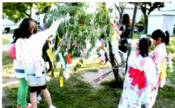
柳の枝に飾り付け