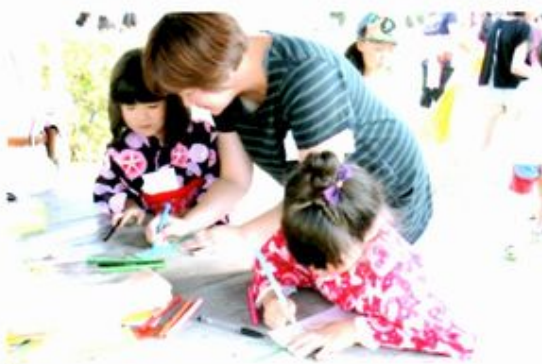
短冊に願いごとを書いて・・・